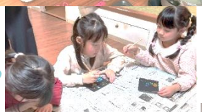
レインボーお絵かき